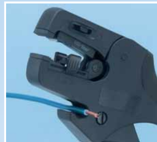
Schneiden bis 10 mm 2 .