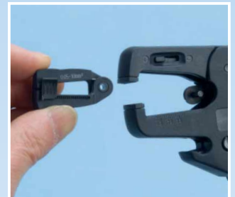
Leicht auswechselbare Abisolierkassette.