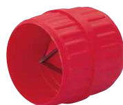
Innen- und Außenfräser