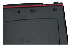
Umlaufende rote Elastomerdichtung