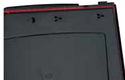
Umlaufende rote Elastomerdichtung