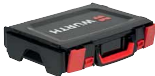
Verschlüsse mit Griffmulden